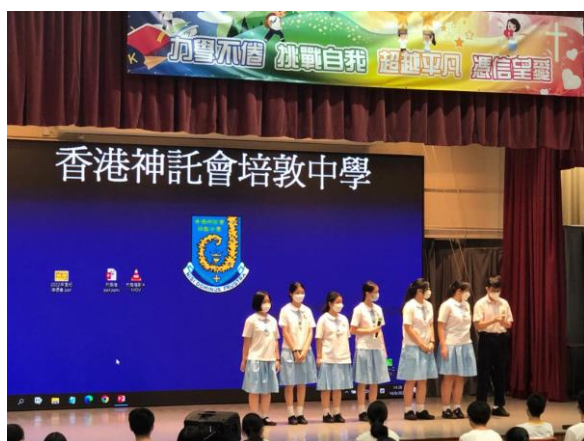
9月份由學長就職禮開始，以學長主導帶領全體學生反思自律守規的重要性。

另外，學校本年度亦引入社會資源，優化學生成長活動素質之餘，亦透過校外資源增聘人手，減少同工的舉辦活動的壓力。本年度由訓導組、輔導組及級統籌，引入由禁毒處基金主辦名為「健康培敦」健康校園三年計劃，以精神健康、自律守規及健康網絡使用為主題，利用計劃的資源增聘輔助人手，將現時推行的活動的效能提升外，本計劃亦有健康檢查部份，將會由中一級入手，避免學生染上濫藥、精神健康及吸煙等不良習慣影響健康。