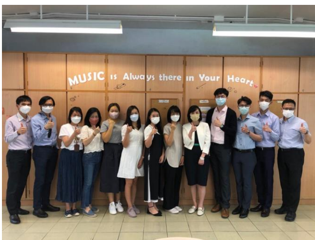
為新入職同學設立導師計劃，協助新同工認識學校。

回應過去教育局視學報告，教師於課堂質素及教學技巧，特別是提升高階思維的技巧學仍需優化。另外，於同工的回應及過去的視學報告中，教師專業發展及評鑑制度也需要優化。去年開始，學校就現行的教師專業發展及評鑑制度，清晰落實三年循環的學科觀課、查簿、行政組別上而下及下而上的評鑑制度，並加強觀課及課業評鑑後的口頭跟進，與同工互動交流，以促進專業發展。另外，教師專業發展組透過教師發展日舉辦專題講座/工作坊、到不同學校參觀交流等，促進同工的專業發展，並透過電郵、佈告板等網上平台發放最新的進修資訊，讓教師適時獲取最新的進修資訊。各協調委員會鼓勵轄下組別，於行政會議及協調會議分享共議，提昇同工對學校政策的共識。本年度亦持續及鼓勵科主任於教職員會議、科主任會議及科務會議分享，讓不同學科也能從分享中互相學習，逐步建立學與教分享文化。另外，所有新任老師也會由資深教師配套師友計劃，讓新到任培敦的老師，於身心靈也得到關顧。