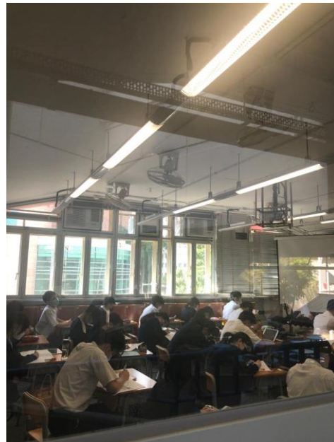
初中自主學習課堂於本年度真正落實執行

生涯規劃組亦會深化現有的全校性生涯規劃，讓不同能力的同學也有發揮的平台。同時，本年度向教育局優化教育心理學家及言語治療師服務得以落實，讓同學特別是有特殊教育能力需要的同學得到更全面的支援，有助其建立積極向上的心智。