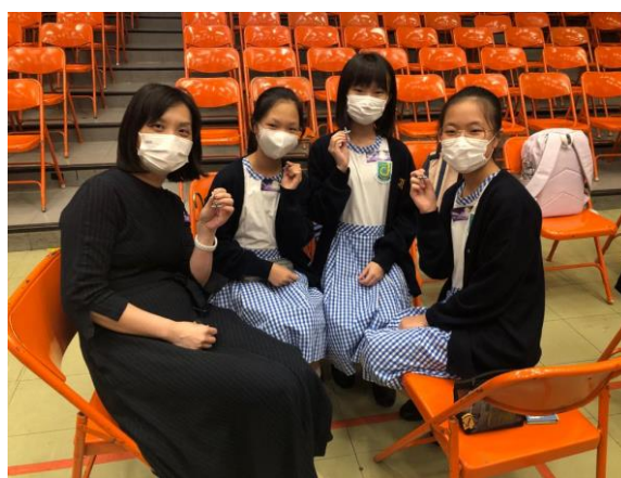
基督徒大聚集- 超過 80 位同學一同參與，分享福音，右邊的中一同學為培基小學畢業生