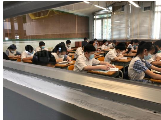
中一及中二圖書館閱讀活動

閱讀推廣組將檢討及優化現行的閱讀推廣政策，統籌及推動全校閱讀政策，鼓勵跨科組之協作，加強閱讀氛圍。例如優化星期五閱讀時段的運作，安排初中同學到圖書館熟習運作及借閱書籍，讓同學初中階段已能建立閱讀的習慣。