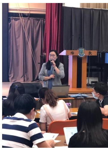
教育心理學家為同工分享如何處理學生情緒需要