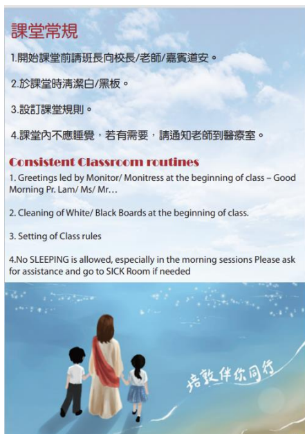
回歸基本 - 重提課堂常規的設立