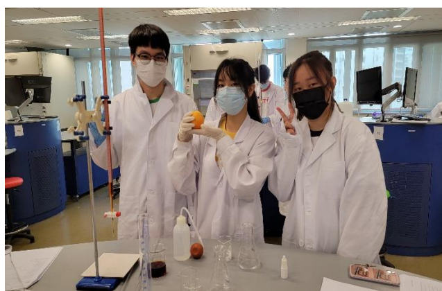
化學科同學於暑期參與浸會大學的暑期化學工作坊