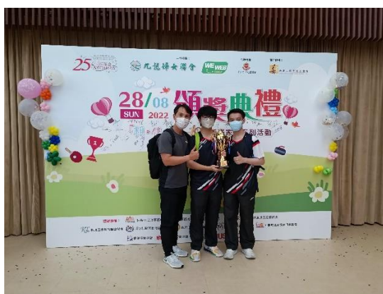
同學代表黃大仙區與奧運運動員比賽乒乓球

累積三年同工對跨學習時段的行政經驗及認識，本年度將更有系統地引入活動及帶領學生走出校園，擴闊同學的視野及經歷。本年度的跨學習時段包括服務、藝術、升學就業、服務學習等校內及校外學習經歷，讓全體同學也能在課室以外的體驗中學習。另外，由於跨越學習時段設於常規課時內，因此，同工籌辦活動時也可以有更多的協作空間，讓所有同學也有機會參與。