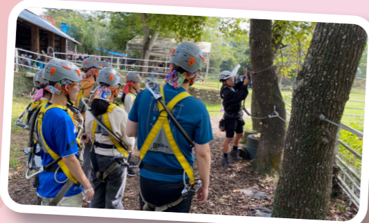
不一樣的戶外成長營