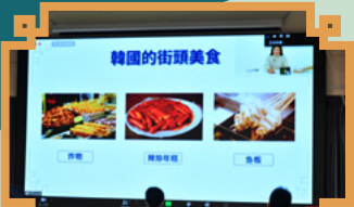
線上實時學習韓語