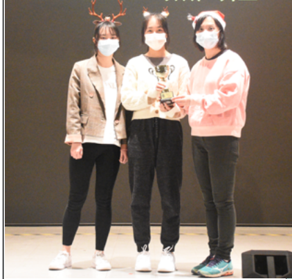
最佳啦啦隊 - 黑門社