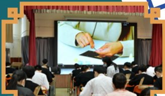
線上實時學習製作韓國傳統手工藝