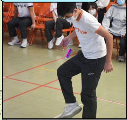
於禮堂進行足毬連踢比賽