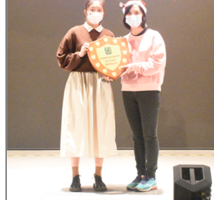
團體冠軍 - 摩利亞社