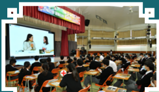
線上實時學習韓語