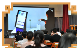
參觀三星創新博物館