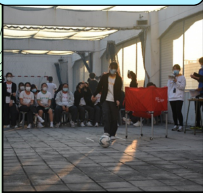
於 8 樓天台進行足球射龍門比賽