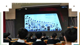
參觀三星創新博物館