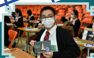
線上實時學習製作韓國傳統手工藝