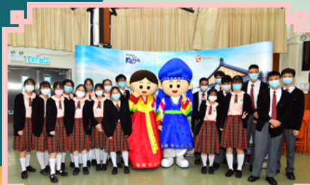
學生與韓國大頭娃娃合照