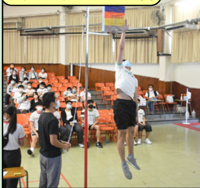
於禮堂進行立定跳高比賽