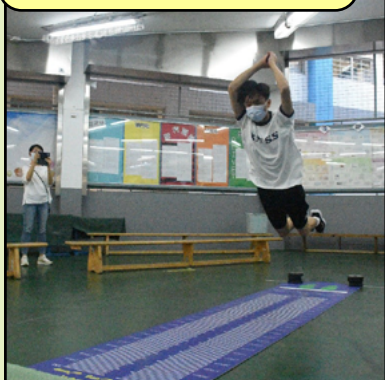
於小禮堂進行立定跳遠比賽