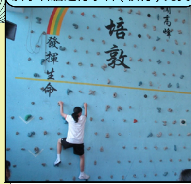
於攀石牆進行攀石(橫行)比賽