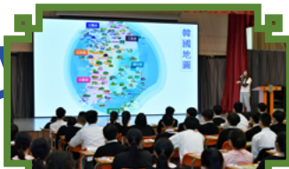
認識韓國地理位置