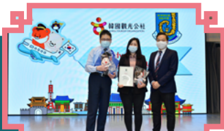
致送紀念品予韓國觀光公社代表

在活動中，學生透過虛擬方式線上參觀韓國最大的電子產業博物館 - 三星創新博物館，了解電子產業的發展史與未來動向，以及三星電子的崛起過程與成功因素。同時，亦透過在線上與韓國的導師即時互動及交流，學習韓國傳統文化和基本韓語。此外，學生更在韓國導師的指導下完成具韓國特色的手工卡片，內容豐富有趣，學生亦表現非常投入。我們期望疫情盡過去，能夠讓莘莘學子親身跑出課室，到境外遊學，擴闊視野。