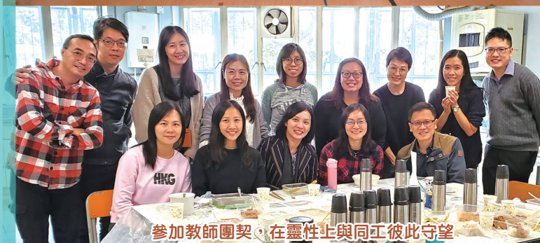
參加教師團契，在靈性上與同工彼此守望