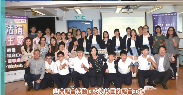
出席福音活動，支持校園的福音工作