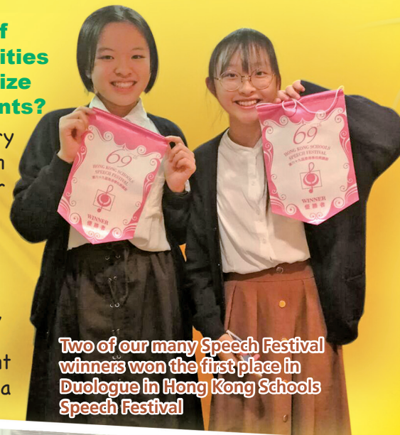
Two of our many Speech Festival winners won the first place in Duologue in Hong Kong Schools Speech Festival

I have been very much involved in extra-curricular activities of different kinds over the years, such as inter-school debating, public speaking and all different kinds of drama