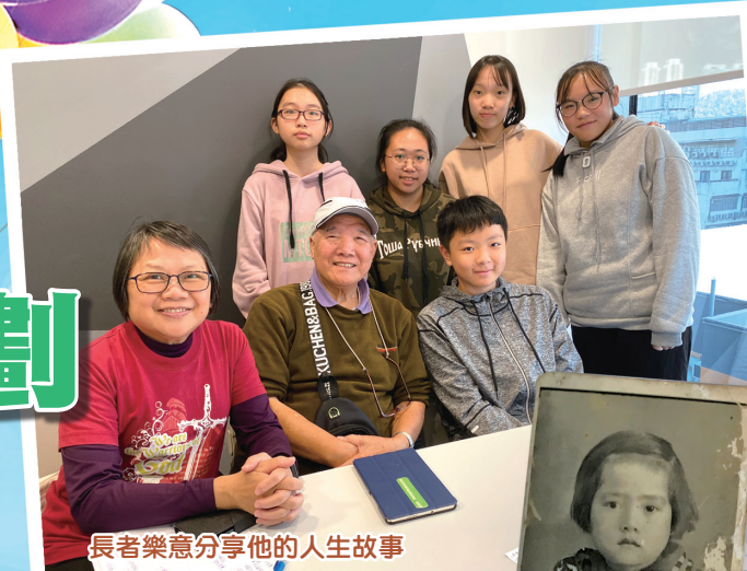
長者樂意分享他的人生故事

在採訪完成後，同學便以不同具創意的寫作、繪畫、剪貼、多媒體等的表達方式紀錄，製成《感受您心・紀錄人生》紀錄冊，在學期結束時送給長者，回饋他們的分享。這個活動既讓同學反思生命的意義，從長者身上學習如何面對逆境，擁抱正面態度細味人生，LED 先鋒亦在每次訪問中送上祝福問候，表達對長者的一份關懷。