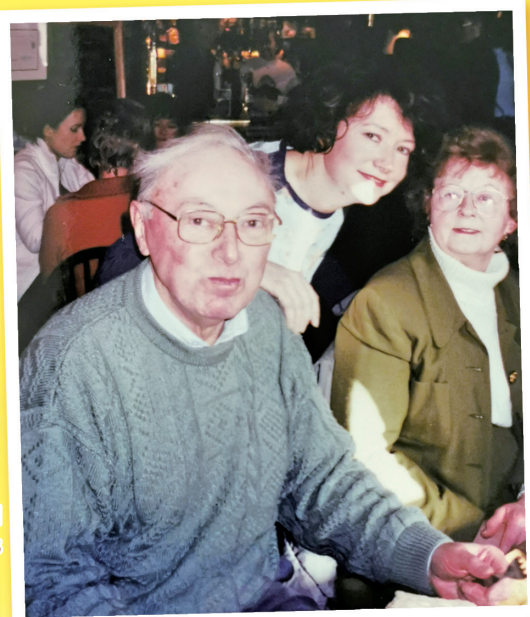
Miss Carey and her parents

One of the main things is to spend more time with my parents, so I won't stay in Hong Kong forever! And besides that, I want to refresh my French and German, as they have got rusty through lack of use over the years, and I also want to pick up piano again, which I learnt in my childhood. I have other hobbies, like cooking, which I find I don't have much time for now, and maybe I'll take up some other courses too. And another thing is that I have never read the whole Bible, so I think it would be nice to have time to actually study the Bible from beginning to end.