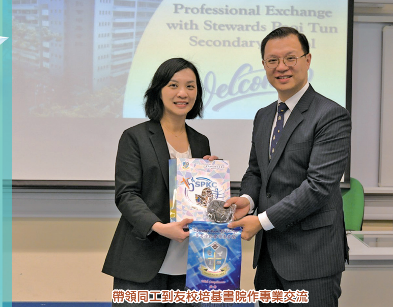
帶領同工到友校培基書院作專業交流

答：我覺得最重要是「搏盡無悔」，希望同學在每個範疇上都盡力而為，特別在自己的弱項上，在將來人生道路上都會有難關，就連簡單不過的事物也會有難關，在每一個環節上，只要搏盡無悔，便已經為自己的人生有所交代。