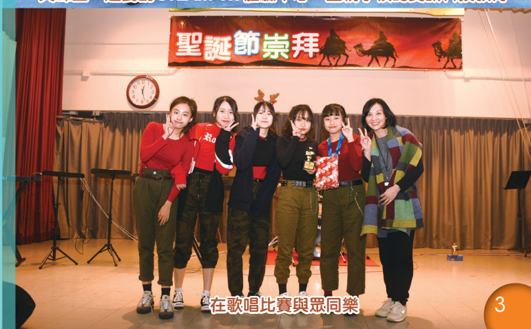
在歌唱比賽與眾同樂