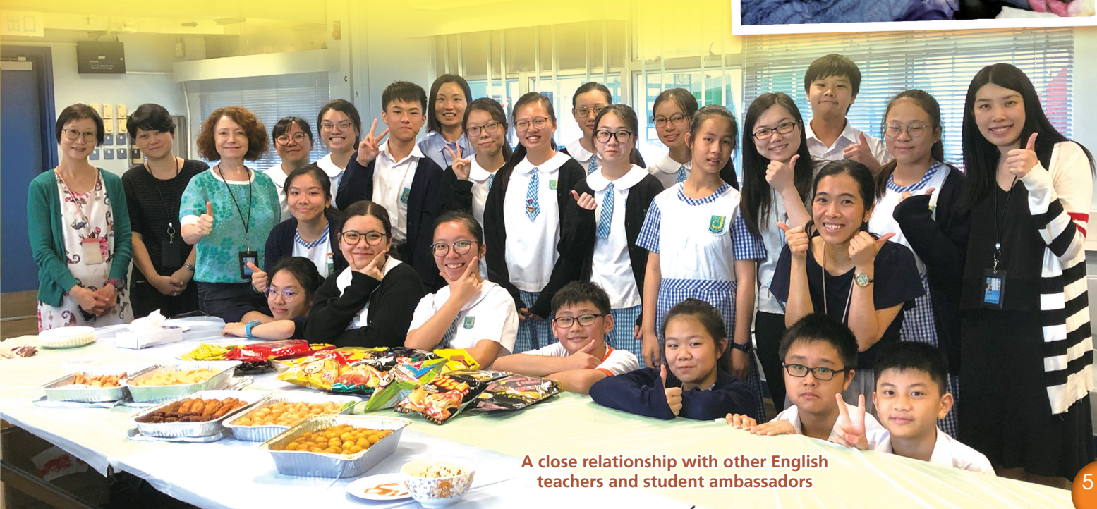
A close relationship with other English teachers and student ambassadors