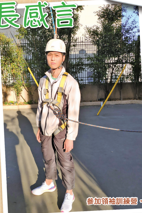
參加領袖訓練營，培養堅毅不屈的精神