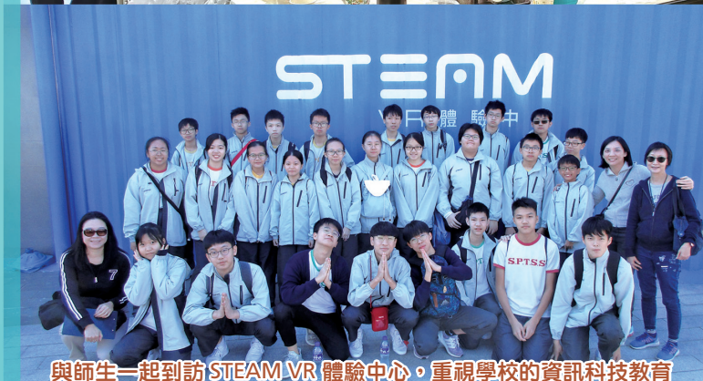
與師生一起到訪 STEAM VR 體驗中心，重視學校的資訊科技教育