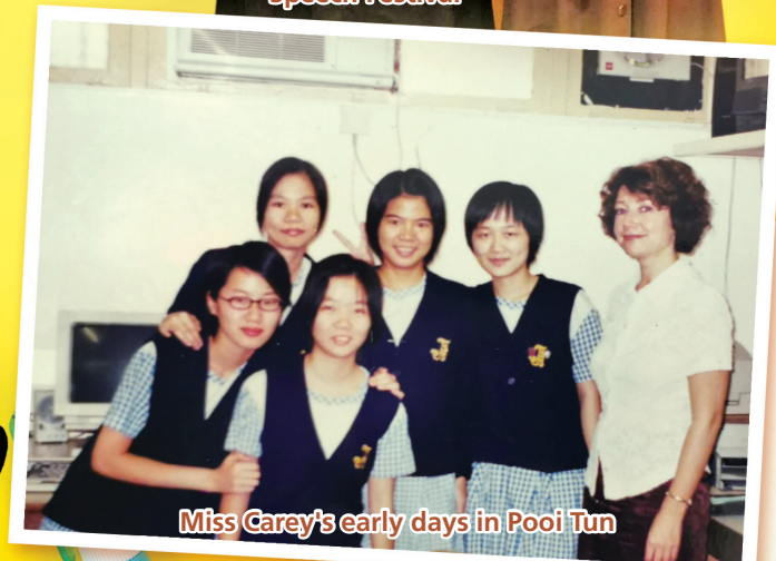
Miss Carey's early days in Pooi Tun