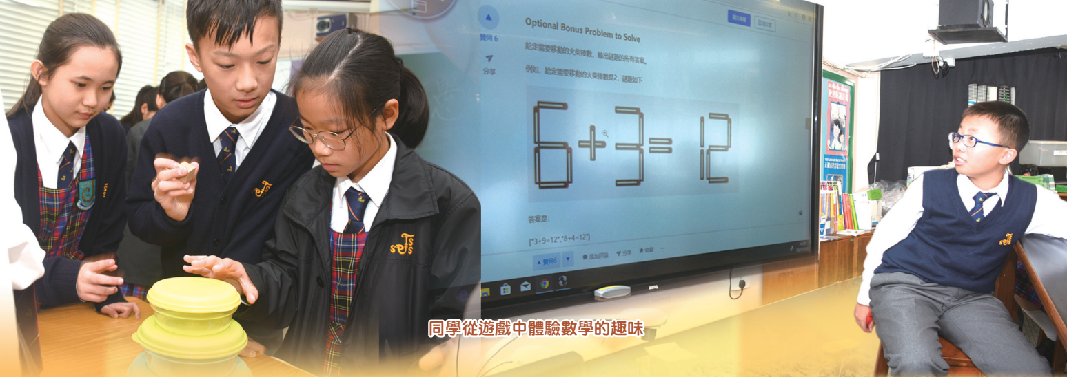
同學從遊戲中體驗數學的趣味